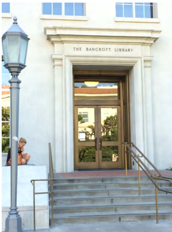
Figura 5. Día final en The Bancroft Library en UC Berkeley.